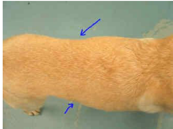
Koira, jolla näkyy vyötärö (labbis)

Koiran mahalinja ei myöskään roiku vaan on joko melkein tasainen tai nouseva. Kun käsi liu'uttaa koiran kylkiä pitkin, tuntee sormiensa alla vain ohuen rasvakerroksen ja sen alla kylkiluut ilman että niitä joutuu etsimään painelemalla. Ylipaino on erityisen tuhoisaa kasvaville pennuille ja nivelsairaille koirille, joiden luustolle se aiheuttaa ylimääräistä rasitusta, sekä vanhoille koirille. Pentujen ei kuulu olla parin kuukauden iän jälkeen "pennunpyöreitä" vaan niiden tulee olla hoikkia ja kylkiluiden pitää tuntua. Lihava pentu/koira on kömpelö, se ei pysty liikkumaan normaalisti, se väsyä helpommin ja se ei välttämättä kykene tekemään tiettyjä "temppeja" tai liikkeitä. Lisäksi metsästyskoirana lihava koira ei ole parhaimmillaan, koska mm. kaislikossa rämpiminen on hoikalle koirallekin raskasta. Mitään tekosyytä ei ole olemassa sille, että koira on ylipainoinen – jos koira syö liikaa, se lihoo ja tämä on vain omistajasta kiinni. Ns. massa tulee koiralle iän myötä ja kuntoilun avulla, ei koiraa syöttämällä. Noutajankokoisen (n. 30 kg) koiran on suunniteltu olevan täysikasvuinen 2-3 vuoden iässä tai joskus jopa myöhemminkin, ei alle vuoden vanhana.