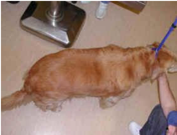
Ylipainoinen koira (kultsu)

Noutajat ovat kovin persoja ruualle ja ikävä kyllä kovin moni noutaja on ylipainoinen. Koira on sopivassa kunnossa, kun ylhäältä katsoen erottaa koiran vyötärön.